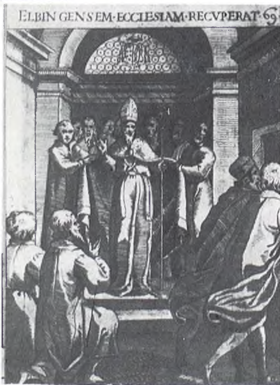
Odzyskanie kościoła w Elblągu.