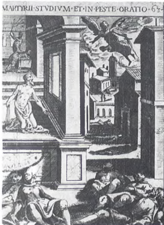
Alegoria modlitw i umartwień kard. Stanisława Hozjusza podczas zarazy jesienią 1564.