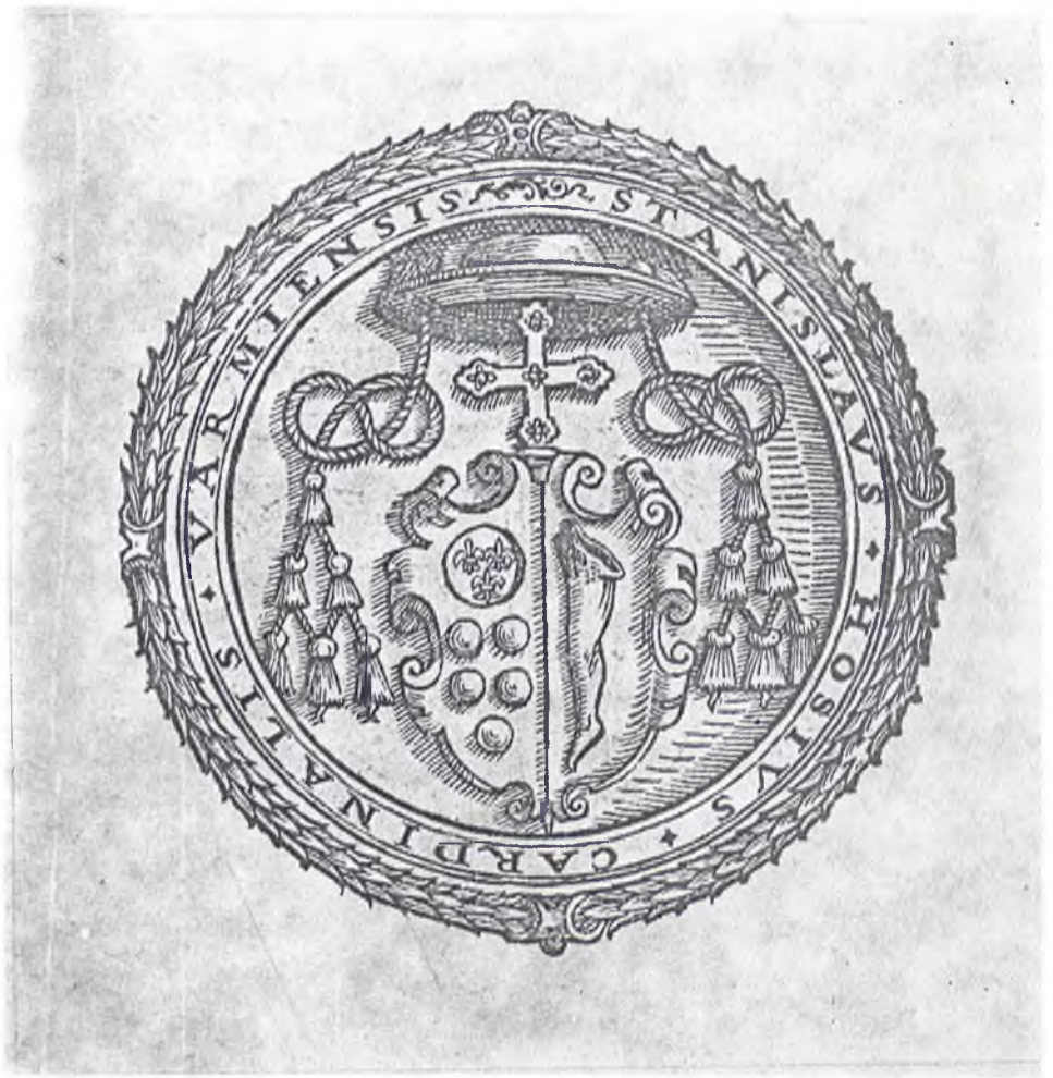
Herb kard. Stanisława Hozjusza.