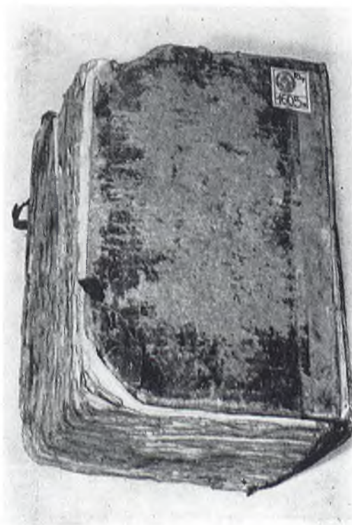
Biblioteka Czartoryskich. Kraków. Rkps 1605.