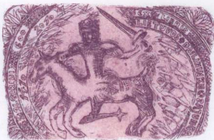
Rima Gaižauskaitė Padėka // Podziękowanie (Lietuva // Polska)