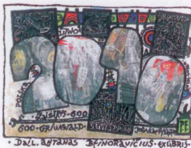
Klemensas Kupriūnas II premija // II premia (Lietuva // Litwa)