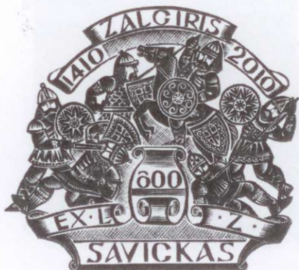
Oleksiy Serdyuk Diplomas // Dyplom (Ukraina // Ukraina).