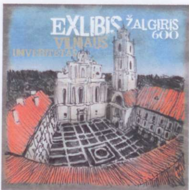
Krzysztof Krawiec Asmeninis apdovanojimas // Nagroda indywidualna (Lenkija // Polska)