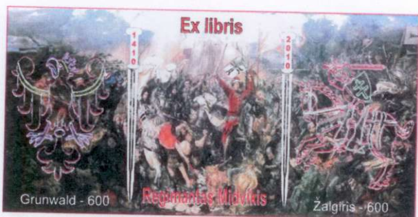
Rajmund Aszkowski Prizas // Nagroda (Lenkija // Polska)