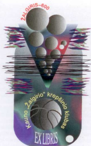
Alfonas Čepauskas Prizas // Nagroda (Lietuva // Litwa)