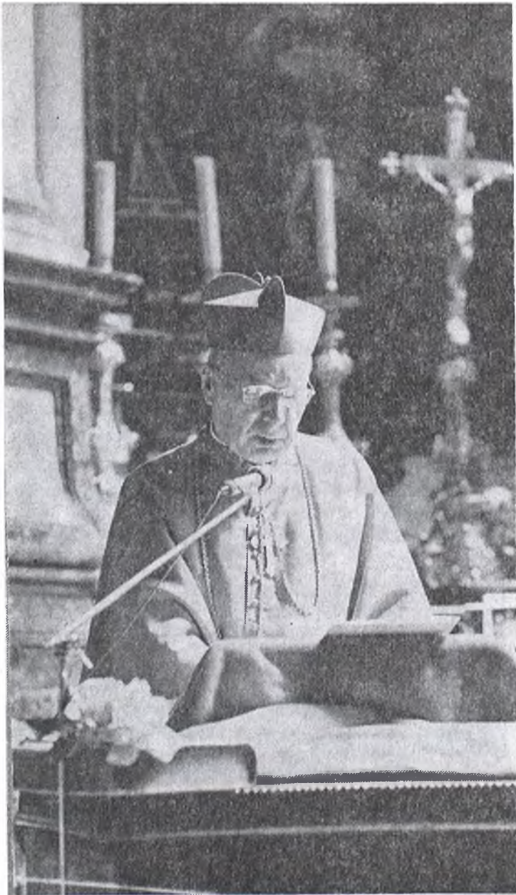
Frombork. J. Em. ks. Stefan Kardynał Wyszyński, Prymas Polski, podczas otwarcia Publicznej Sesji Episkopatu Polski w bazylice katedralnej.