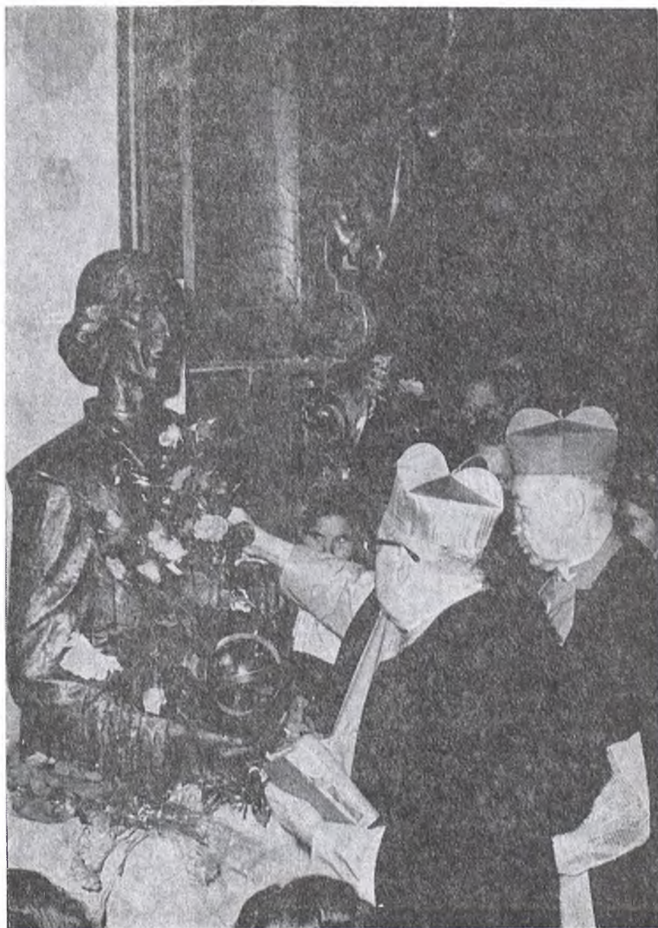
Prombork. Pomnik Mikołaja Kopernika w bazylice katedralnej ufundowany przez Warmińską Kapitułę Katedralną.