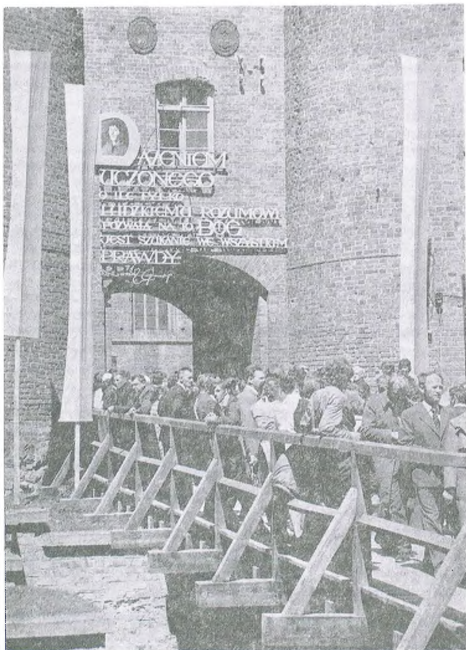
Frombork. W oczekiwaniu na rozpoczęcie uroczystości