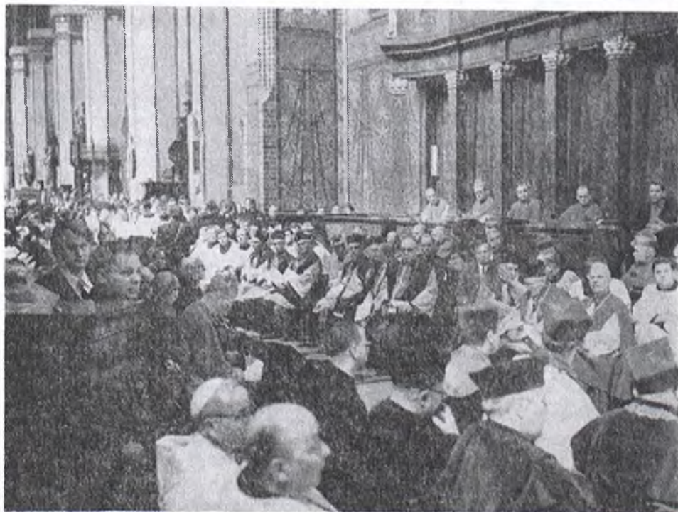
Frombork. Uczestnicy Publicznej Sesji Episkopatu Polski.