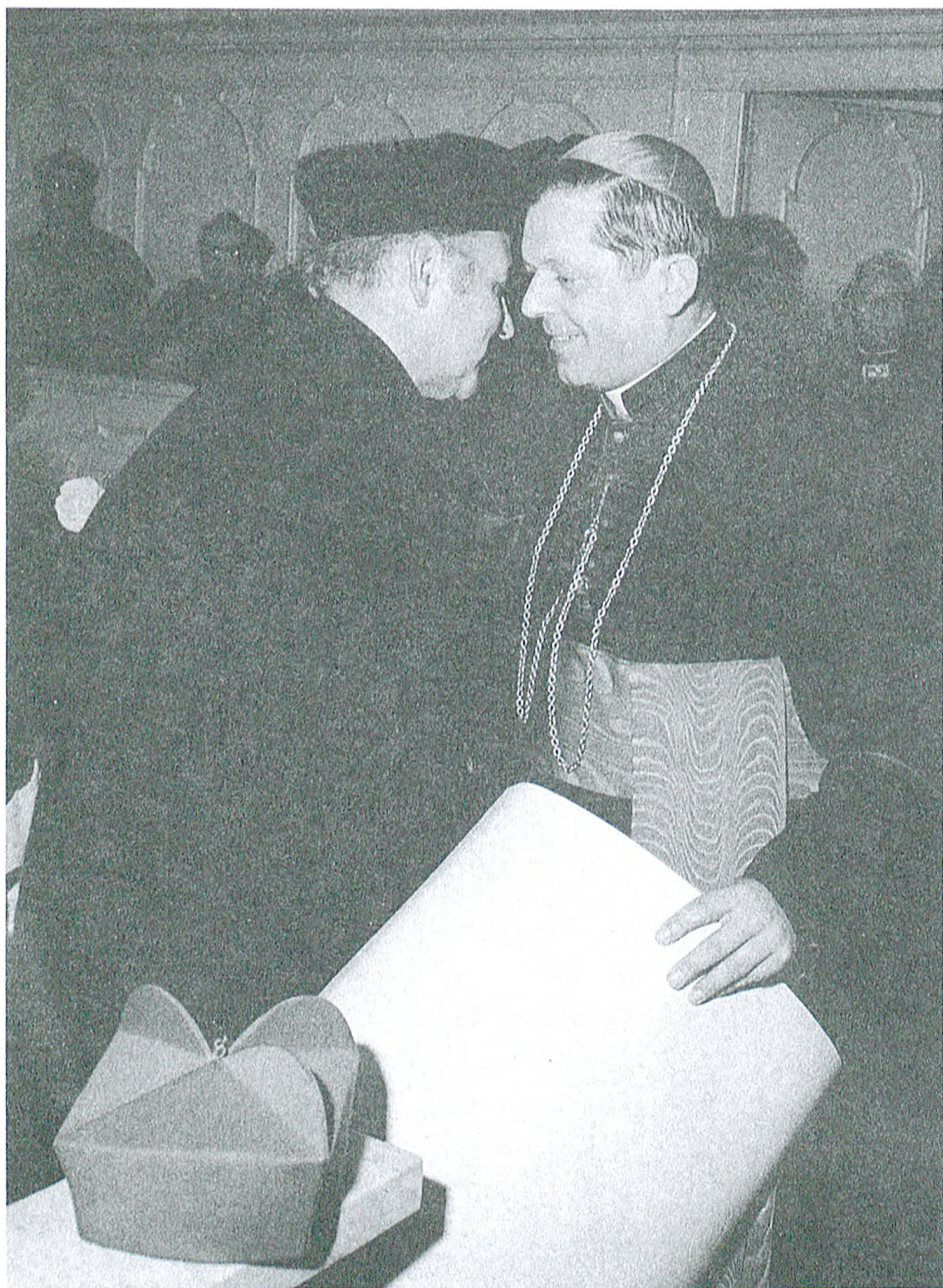
J. EM. KARDYNAŁ JÓZEF GLEMP, PRYMAS POLSKI, OTRZYMUJE Z RĄK PROMOTORA, DZIEKANA WYDZIAŁU PRAWA KANONICZNEGO, DYPLOM DOKTORA HONORIS CAUSA, NADANY PRZEZ SENAT AKADEMII TEOLOGII KATOLICKIEJ