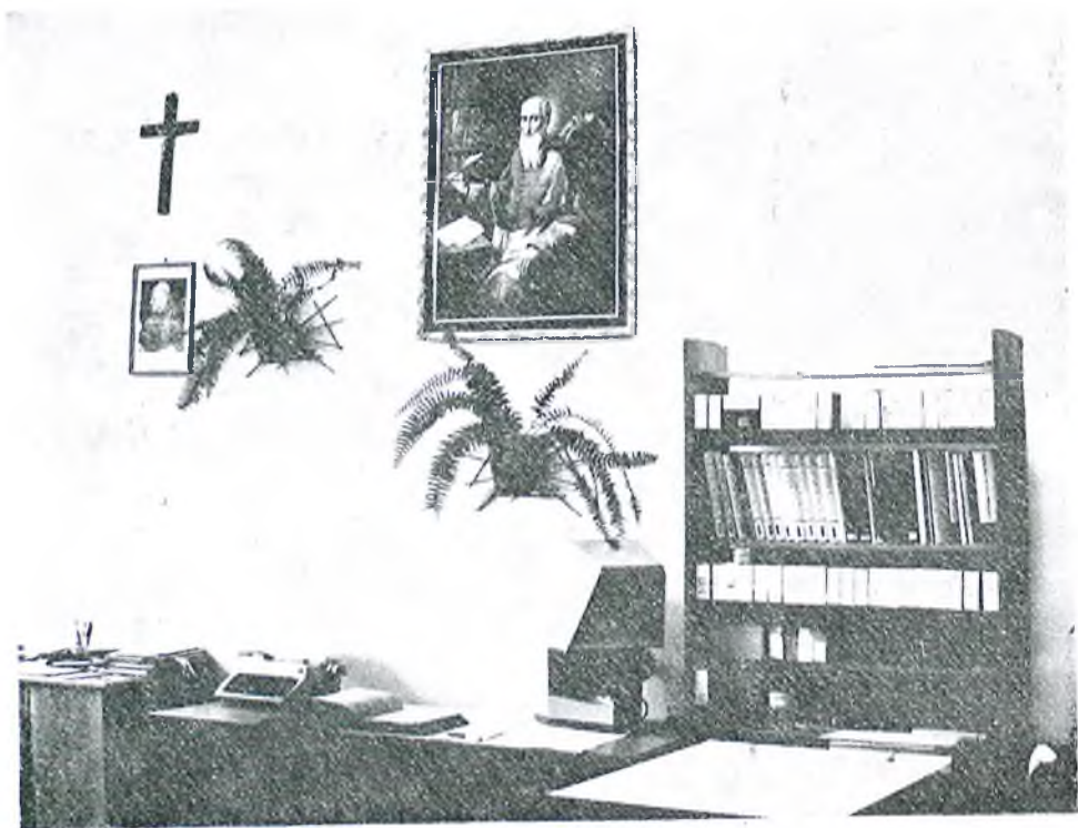
Pracownia Hozjańska z portretem Hozjusza na ścianie