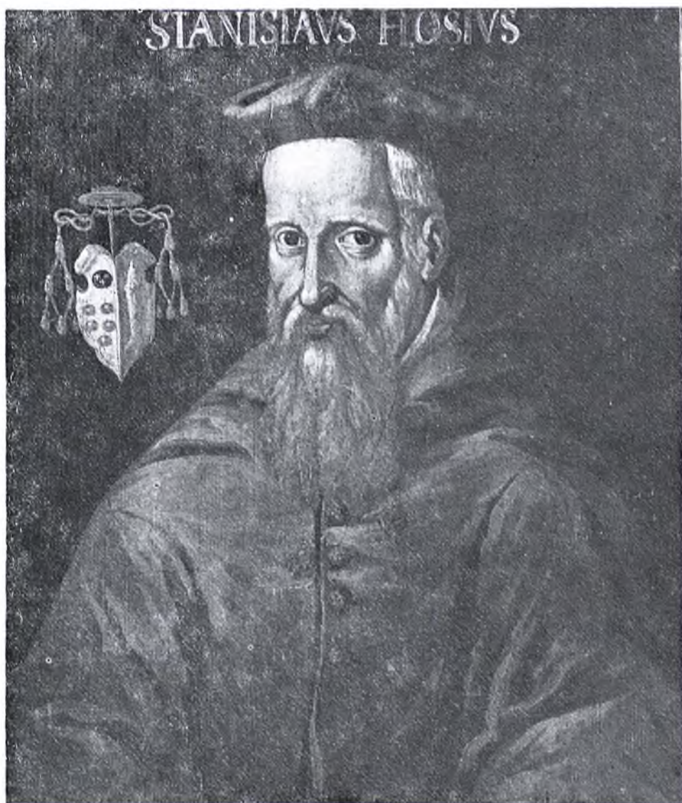
Portret Hozjusza w domu biskupim w Olsztynie