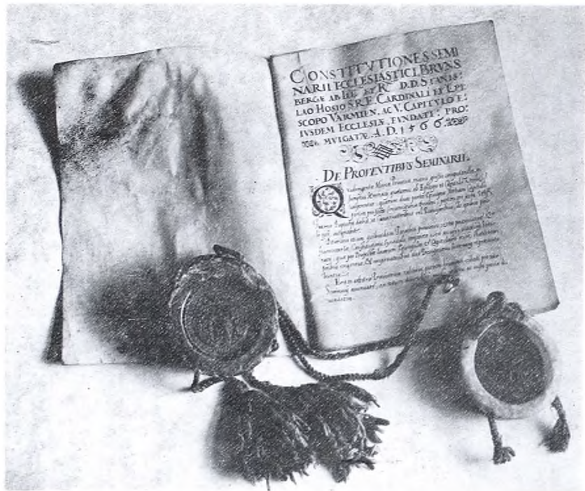
Najstarszy regulamin Seminarium Duchownego w Braniewie tzw. Konstytucje Hozjańskie z 1566 r.