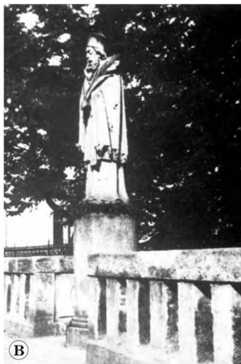
Statua św. Jana Nepomucena na olsztyńskim moście na Łynie. A — po odsłonięciu w 1869 r.; B — po przestawieniu na obrzeże mostu w 1909 r.; C — po restytucji i odsłonięciu 25. lipca 1996 r.