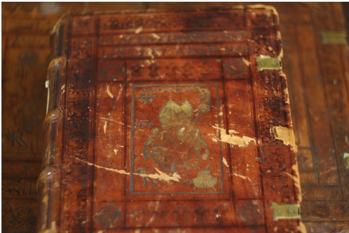
Fot. 4. Superekslibris Jana Dantyszka na oprawie Sd 57,1-3 adl.