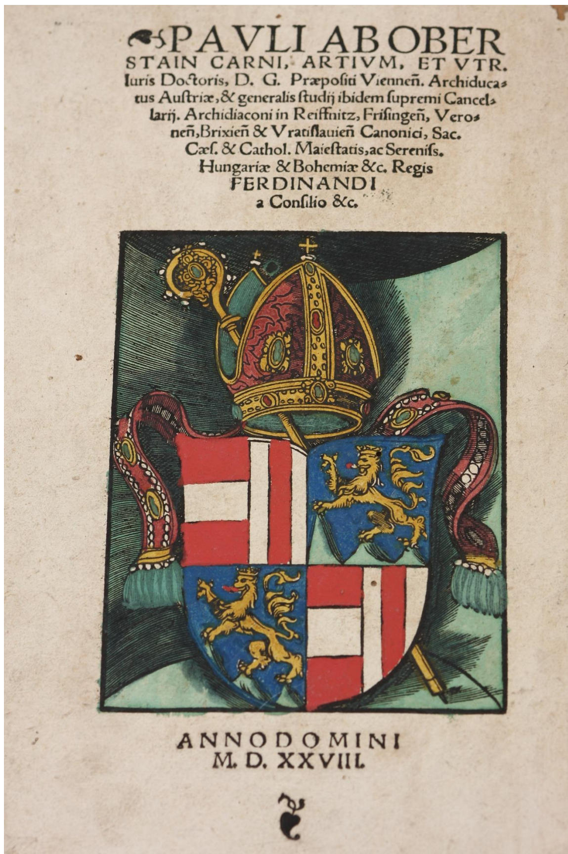
Fot. 5. Ekslibris Paulusa Obersteinera w De 216,1-3 adl.

Artykuł powstał w wyniku realizacji projektu "Digitalizacja starych druków i inkunabułów z kolekcji biskupa warmińskiego Jana Dantyszka" dofinansowanego z programu „Społeczna odpowiedzialność nauki” Ministra Nauki i Szkolnictwa Wyższego.