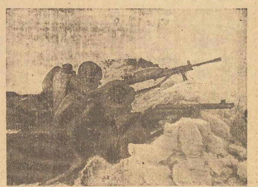
Mimo ogromnych mrozów, sięgających 20 stopni, ruszyła zwycięska ofensywa. Spiętrzony łód Wistę chronił gniazda karabinów maszynowych.