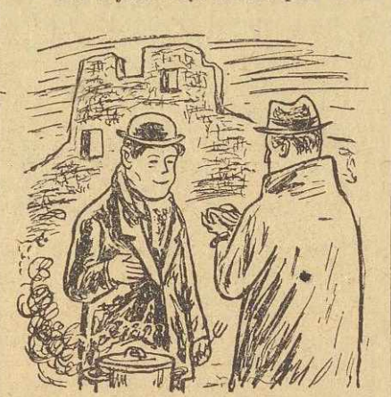
galny — spytał Zygmunta. Pytanie poddyktowane było przekorą, a trochę i twardą skórą parówek, która gnio-

— No a jaki rząd uważa pan za legalny — spytał Zygmunta. Pytanie poddyktowane było przekorą, a trochę i twardą skórą parówek, która gnio-