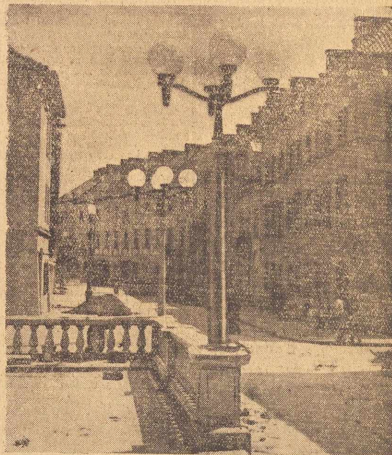
Rocznice Święta Wyzwolenia czeła wczoraj całą Polską. Szczególnie uroczyste obchody ten dzień Warszawy, tu bowiem koncentrowały się najważniejsze uroczystości: otwarcie kilkunastu fabryk, odsłonięcie pomnika — Kopernika i Żygmunta, oraz oddanie do użytku wielkiej arterii komunikacyjnej Trasy W—Z, której otwarcia dokonał Prezydent R.P. Bolesław Bierut. Na uroczystości te przybyli wieloletni rzesze warszawiaków, podziwiający piękno odbudowanych zabudowań i Trasy. Wielkie wrażenie wywarła na wiedzających powstająca z gruzów kolonia mariensztacka, odbudowana w dawnym stylu. Na zdjęciu: jedna z uliczek Mariensztatu.