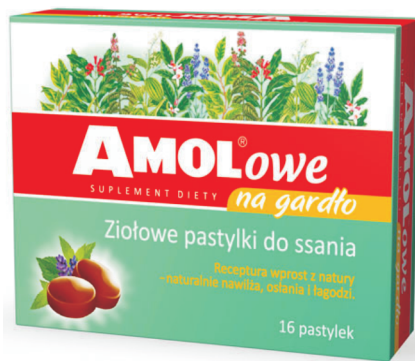
Rys. 7 Opakowanie leku AMOLowe na gardło (producent: TAKEDA)

W przypadku poniżej zaprezentowanego opakowania leku (rys. 7) zastosowano jeszcze jeden, interesujący zabieg z zakresu mikrotypografii. Oto nazwa handlowa leku AMOL , pod którą dotąd kryły się sprzedawane w charakterystycznych butelkach krople ziołowe, została dostosowana do wymogów nowego produktu, jakim są pastylki do ssania. Na opakowaniu owych pastylek nazwa handlowa AMOL , tworząca subpłaszczyznę tekstu, została rozszerzona o sufix -owe oraz korespondujący z nim dopisek na gardło . Dzięki zastosowaniu różnych stylów pisma udało się zachować dotychczasowy zapis nazwy handlowej leku (litery drukowane), płynnie wkomponowując w niego sufix -owe i tworząc w ten sposób przymiotnik odrzeczownikowy: Amolowe .