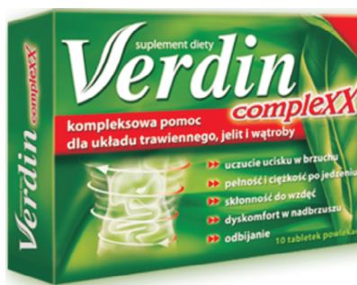
Rys. 6. Opakowanie leku Verdin complexx (producent: LE LABORATOIRE DE LA NATURE)

Także w przypadku leku Verdin complexx (rys. 6) można zaobserwować szereg rozwiązań typograficznych, które wpływają na percepcję potencjalnego odbiorcy. Także w tym przypadku kolor zielony stanowi nawiązanie do składu leku. Podobną rolę pełni również element mikrotypograficzny, jaki zastosowano w nazwie handlowej leku: litera V jest stylizowana w taki sposób, by jej prawy element przypominał liść. Subpłaszczyzna obrazu ma na celu informację o obszarze działania leku. Inaczej niż w przypadku poprzedniego opakowania (rys. 5) tutaj to obraz ludzkiego tyłowa pojawia się jako pierwszy z lewej, a tuż za nim można znaleźć wyszczególnione opisy sytuacji, w których można i należy zastosować omawiany lek. Rolę pośrednika między subpłaszczyzną obrazu a tą