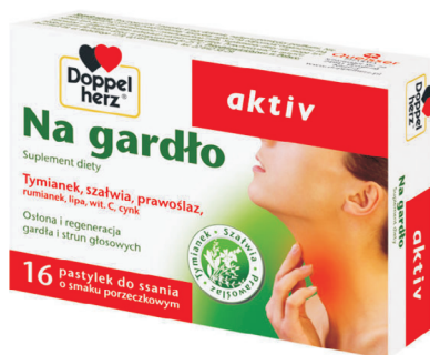
Rys. 5. Opakowanie leku Doppelherz Aktiv Na gardło (producent: QUEISSER)