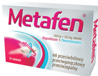
Rys. 2. Opakowanie leku Metafen (producent: POLPHARMA)

Analiza korpusu badawczego wykazała, że obie subpłaszczyzny, z których pierwsza operuje tylko elementami językowymi, a druga – elementami obrazowymi, mogą także dysponować swoimi wtórnymi subpłaszczyznami. W przypadku opakowania leku Metafen (rys. 2) można odnaleźć wtórną subpłaszczyznę tekstu, dzięki której przywołane są najpierw dwa główne składniki leku (tzn. ich nazwa oraz zawartość w mg), a poniżej także informacje odnośnie do działania leku. Warto zauważyć, że właśnie te dane umieszczone są w bezpośrednim sąsiedztwie subpłaszczyzny obrazu, przez co wpływają także na odbiór tego, co obrazowe (naturalny kierunek czytania tekstu od góry do dołu i od lewej do prawej może uzasadniać początkowe skupienie wzroku na subpłaszczyźnie tekstu, a następnie płynne przeniesienie go na subpłaszczyznę obrazu i wtórną subpłaszczyznę tekstu). Towarzyszy temu następujący obrazowy akt mowy : Metafen to lek w kapsułkach, które są tu zaprezentowane, i który działa przeciwbólowo, przeciwgorączkowo i przeciwzapalnie 11 .