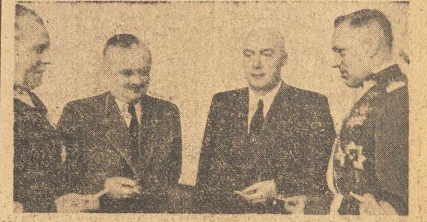
Marszałek Rokosowski (na prawo w rozmowie z premierem Cyrankiewiczem i wicepremierem Mincem i marszałkiem Żymierskim

Rada Państwa, jakkolwiek w skład jej wchodzi Prezydium Sejmu, jest w swojej kolegalności ciałem szerszym i posiadającym szczególne kompetencje w układzie najwyższych władz państwowych. Wypływa to przede wszystkim z faktu, że na czele tego organu stoi Prezydent Rzeczypospolitej. Wskutek tego jest rzeczą słuzną na zniesienie przepisu ograniczającego skład liczbowy Rady Państwa, biorąc w dodatku pod uwagę, że każdorazowy wniosek o uzupełnienie jej składu wymaga jednomyślniej zgody