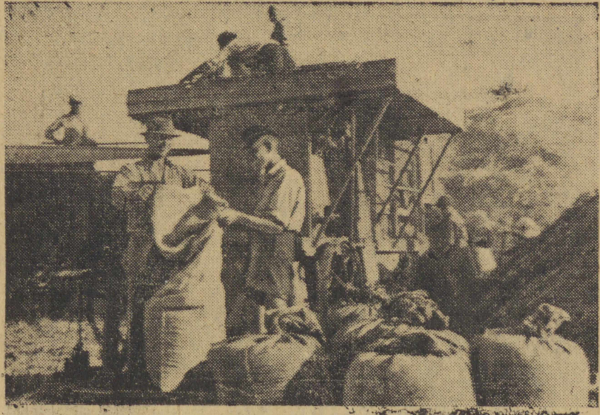
Omioty w spółdzielni produkcyjnej w Kamionce pow. Lubartowski...