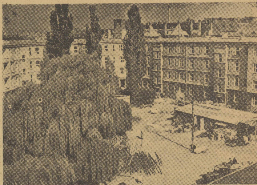
Szczecin jest miastem polskim, w którym buduje się największy port węglowy w Europie i siódmy w świecie co do wielkości taśmowicze przetadowujący węgiel i jest również miastem, w którym rośnie nowa, piękna dzielnica studencka. Jeszcze w tym roku dwa tysiące studentów zamieszka w 860 nowoczesnych izbach. Na zdjęciu fragment budującej się dzielnicy.