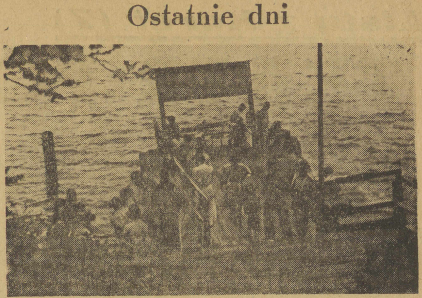
Choć wieczory i ranki są już dość chłodne Warmia i Mazury stały się terenem licznych wycieczek turystycznych i wesołych. Na zdjęciu przystań w Rucianem, z której za chwilę odjedzie statek do Mikołajek.

To jest właśnie niewątpliwą zasługą załogi Garbna i dlatego stawiamy ją za wzór innym PGR-om. Zbliża się akcja wykopków. Niewątpliwie PGR i spółdzielnie produkcyjne uzyskają pomoc społeczną miast. Można wykreślić i tę okazję, aby pieniądze zarobione za pracę społeczną przekazane były na cel społeczny — NA BUDOWĘ WARSZAWY.