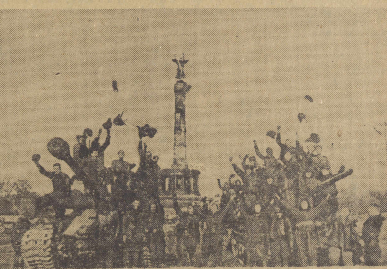
Przed 7 laty Armia Radziecka, która miała główny ciężar walki z Wehrmachtem, zmusiła do kapitulacji hitlerowską Rzeszę. Dzień 9 maja 1945 r. uznany został za Dzień Zwycięstwa nad faszyzmem, za dzień wyzwolenia narodów Europy, za dzień triumfu sił pokoju i socjalizmu nad siłami agresji i kapitalizmu. Demokratyczne Niemcy uważają datę 8 maja — datę podpisania kapitulacji — za swoje Święto Wyzwolenia, od złowrogię dla samych Niemców imperializmu niemieckiego. Na zdjęciu: czolg radziecki pod słynną Kolumną Zwycięstwa w Berlinie.