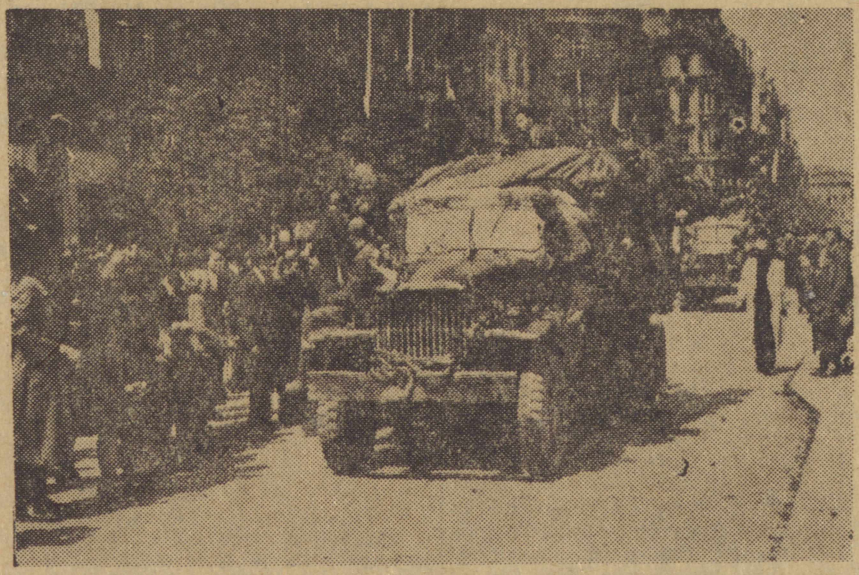
9 maja Armia Radziecka wyzwoliła stolicę Czechosłowacji Pragę. Dzień ten narodził bratniej republiki obchodzą jako swoje święto narodowe. (Patrz artykuł na str. 3ef). Na zdjęciu: żołnierze radzieccy na Vaclauske Namesti w Pradze witani przez mieszkańców...