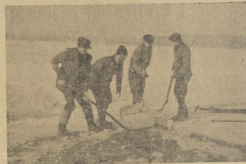
PSS i MHD przygotowują zapasy lodu, zwożąc go z pobliskiego jez. Krzywego i Długiego.