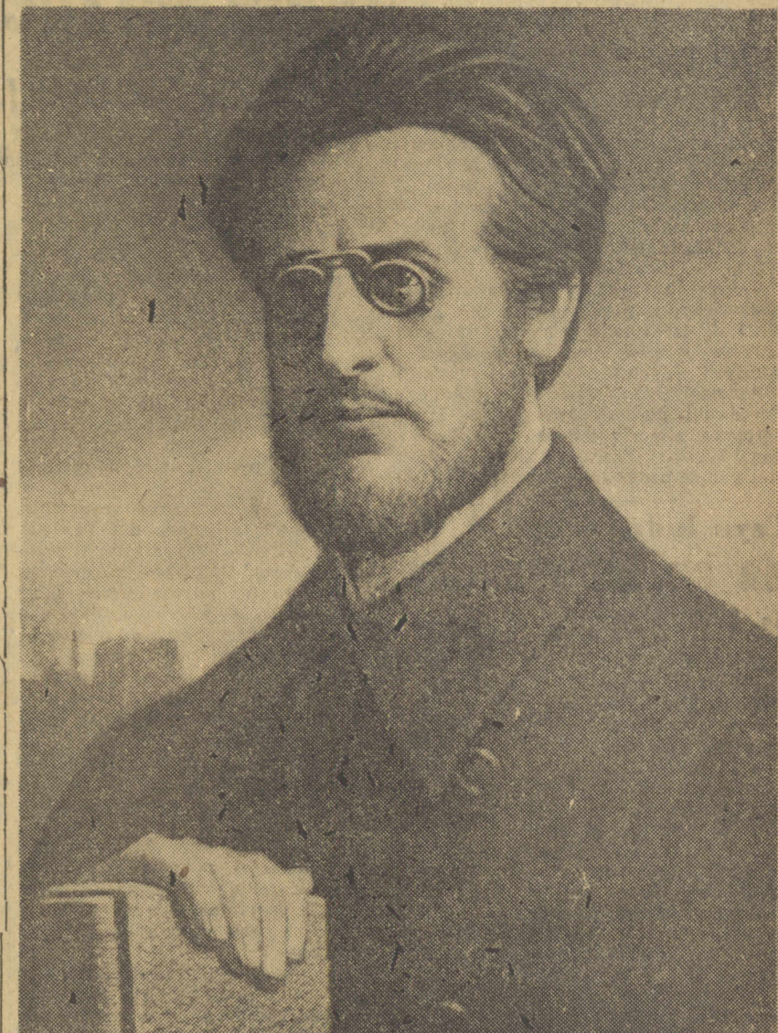
65 lat temu zmarł w lochach twierdzy Schlüsselburskiej twórca „Wielkiego Proletariatu” — pierwszej robotniczej rewolucyjnej partii polskiej Ludwik Waryński.

Wielkiemu bojownikowi wyzwolenia ludu pracującego Polski poświęcamy artykuł na str. 3.