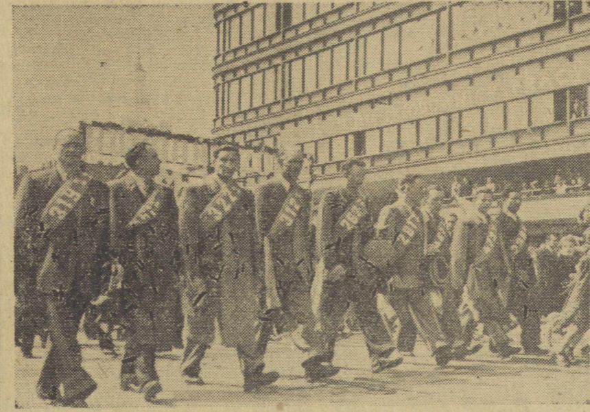
Przepracowani szarfami idą przewodnicy pracy.