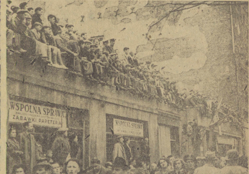
Zbrajano już miejsca na chodnikach. W takim tłumie i dach jest dobrą trybuną.