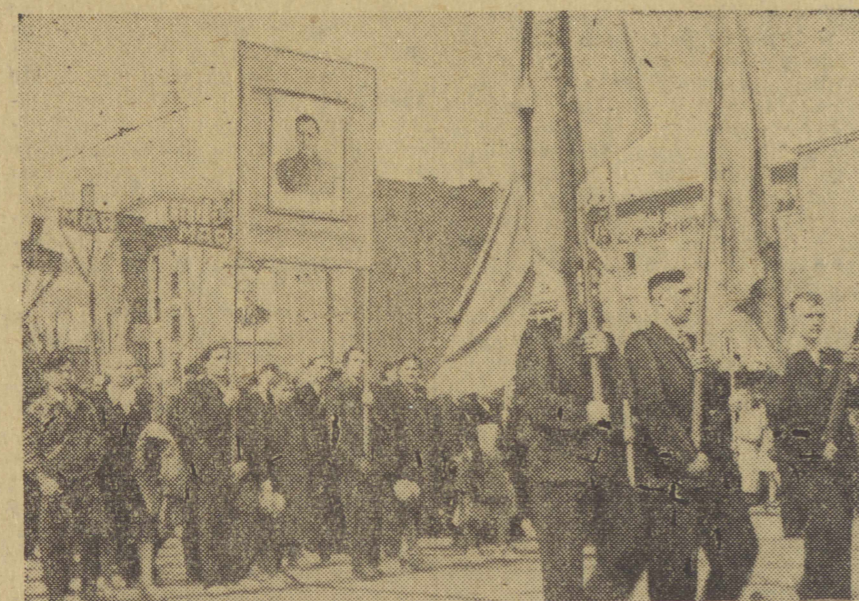
Gorąca owocja. Idą budowniczości Pałacu Kultury.

Pragnąc przyczynić się do rozwoju gospodarczego krajów Ameryki Łacińskiej ZSRR gotów jest dostarczać tym krajom maszyny i urządzenia przemysłowe. Dostawy te mogą być spłacane ratami. Delegacja radziecka, pragnąc skorzystać z okazji, zaprasza kilkuosobowe delegacje z każdego kraju Ameryki Łacińskiej oraz wyższych urzędników sekretariatu Komisji Gospodarczej ONZ dla spraw Ameryki Łacińskiej, aby odwiedzili ZSRR w celu zapoznania się z rozwojem przemysłu i rolnictwa w Związku Radzieckim.