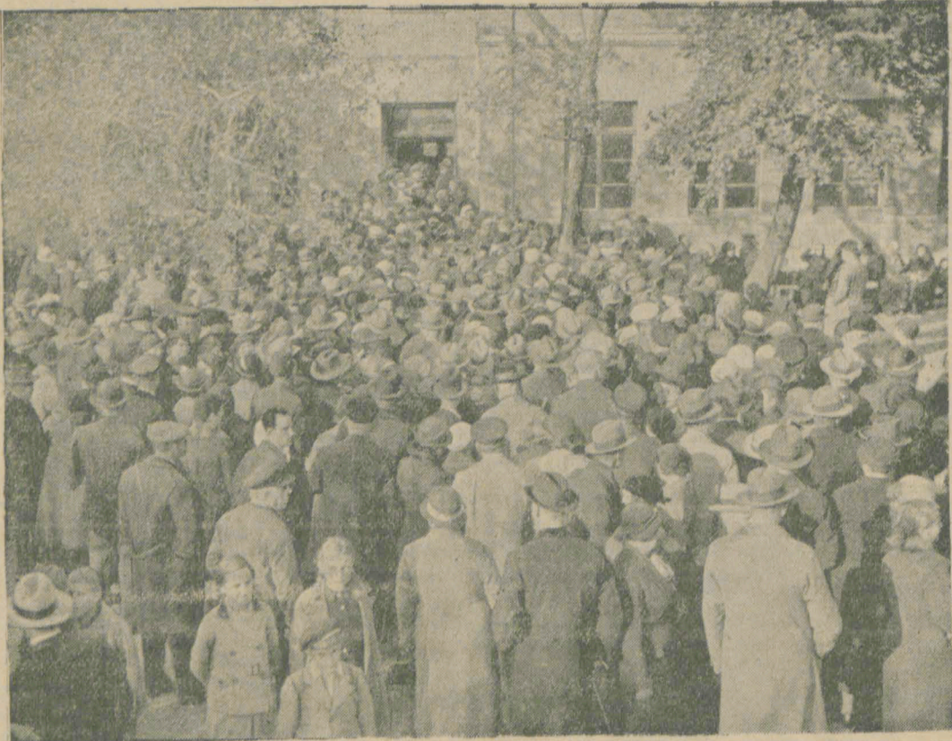
Tłumy wyborców przed lokalem wyborczym w Klajpedzie czekają, by oddać swój głos.