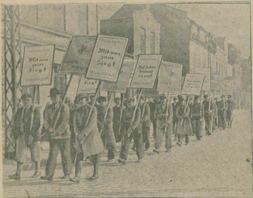
Niemiecka propaganda wyborcza na ulicach Klajpedy