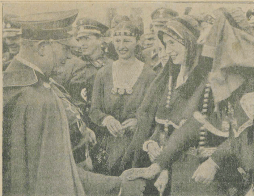
W obecności premiera Goeringa odbyła się w Eiderstedt nad morzem uroczystość poświęcenia ro-

Samoloty włoskie rozwijają ożywioną działalność w okolicy Makalle. Taktyka ich uległa zmianie. Nie rzucają obecnie bomb, lecz z nieznacznej wysokości ostrzeliwiają z karabinów maszynowych oddziały abisyńskie.