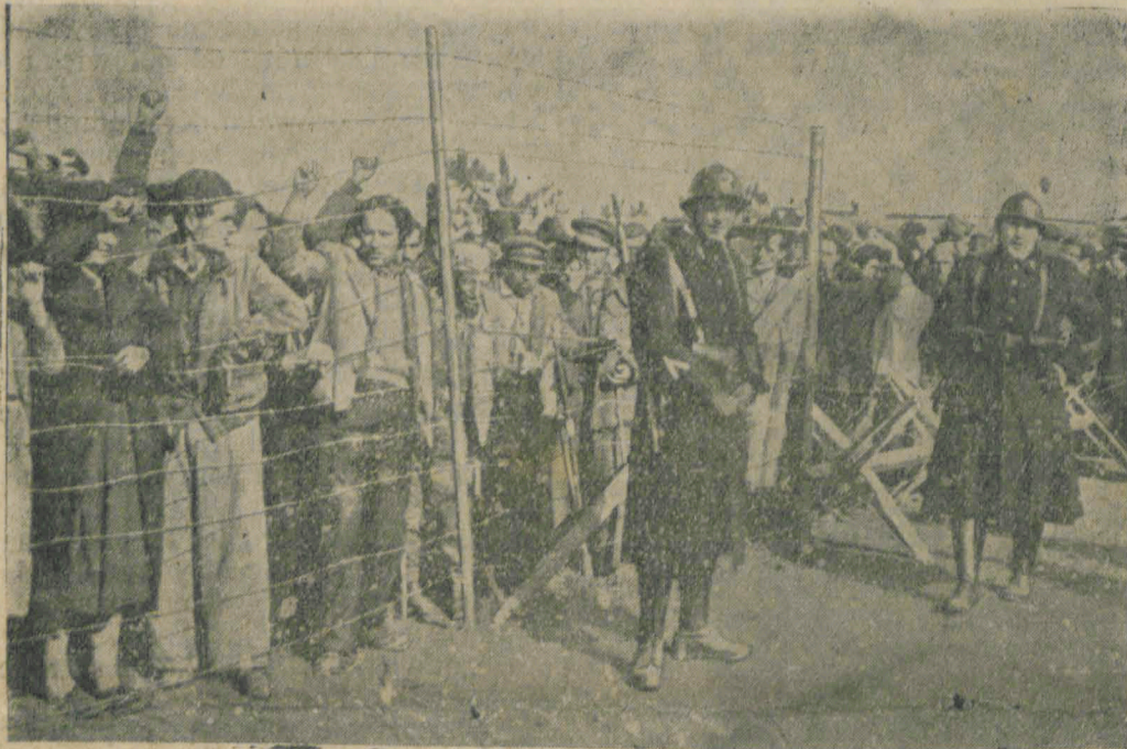
Obóz dla uchodźców hiszpańskich

Pod Olot w klasztorze Collal uwolniono 260 kobiet i dzieci, uwięzionych tam przez nieprzyjaciela. Poza tym uwolniono tam 125 mężczyzn, wśród nich wielu oficerów sprzyjających gen. Franco, którzy jeszcze we środę mieli być rozstrzelani. W Olot zdobyto również 7 fabryk amunicji, poza tym zaś olbrzymie składy dzieł sztuki i kosztowności wywiezionych przez milicjantów z Tarragony i Barcelony.