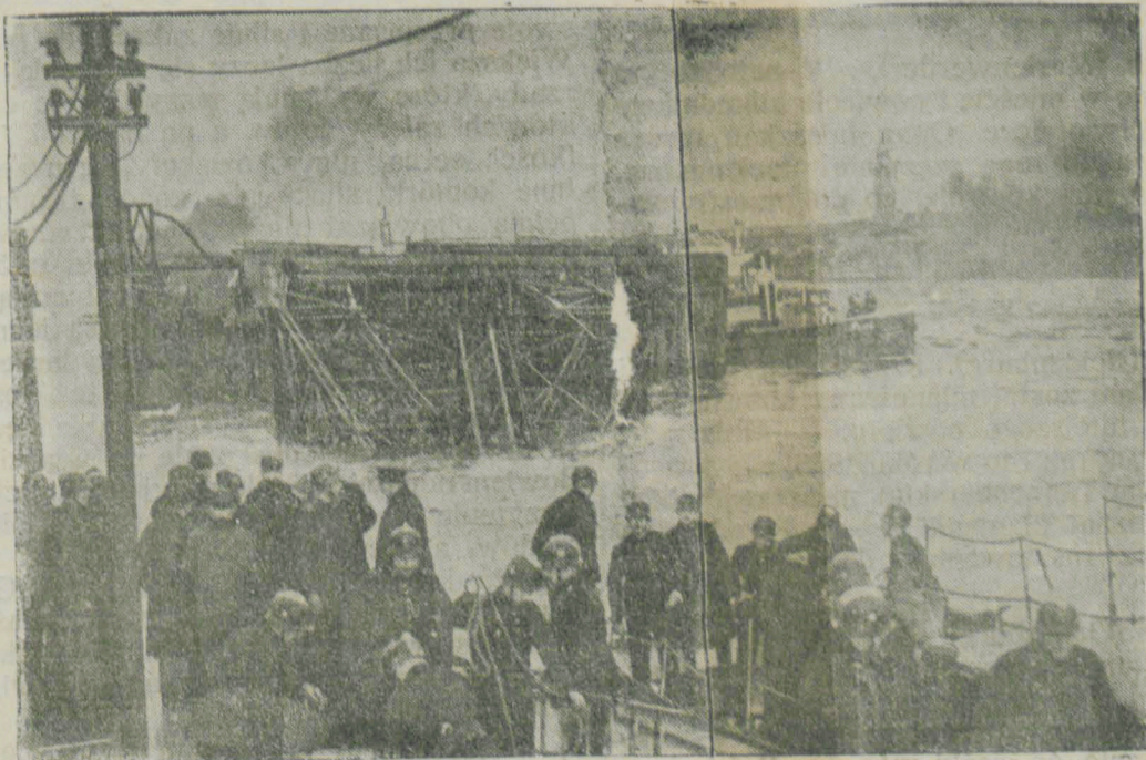
Na obrazku: Akcja ratunkowa straży ogniowej. Na tylnym tle kolos stalowy obalonego dźwigu.

Poza tym dotkliwie kary pieniężne wymierzono trzem innym oskarżonym za przekroczenie przepisów dewizowych z niedbalstwa.