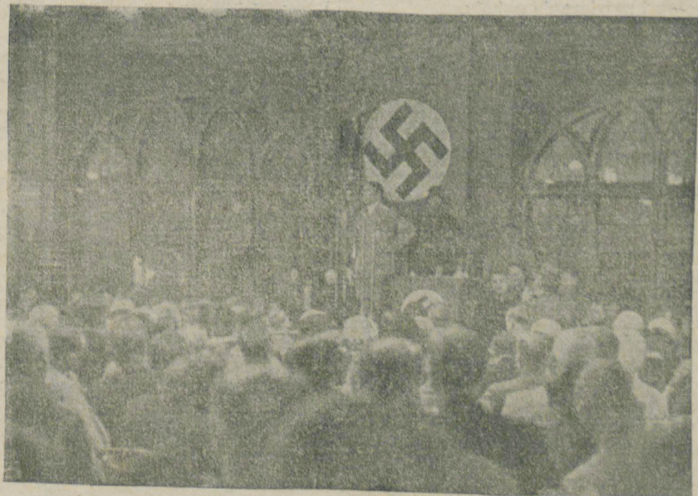
W Monachium odbyła się uroczystość 18 rocznicy utworzenia partii narodowo-socjalistycznej. W uroczystości brał udział Kanclerz Hitler, który wygłosił przemówienie do zebranych na uroczystości pierwszych członków partyjnych.

„Stampa” podkreśla, że interesy Polski i Włoch nie są ze sobą sprzeczne i dlatego nie stwarzają trudności między obu państwami. Polityka ministra Becka, który był współpracownikiem Marszałka Piłsudskiego, ożywiona jest realizmem i zyskała dla Polski autorytet międzynarodowy.