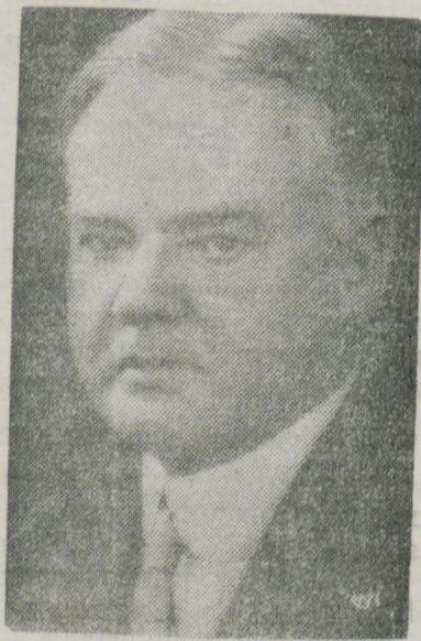
B. Prezydent Hoover w Polsce.

Wysiadającego z wagonu prez. Hoovera powitała uczennica jednej ze szkół poznańskich chlebem i solą, wręczając mu wiązankę kwiatów. Po przedstawieniu mu obecnym Dostojny Gość opuścił dworzec wśród okrzyków licznie zebranej publiczności „Niech żyje” i udał się samochodem do hotelu „Bazar” gdzie zamieszkał.