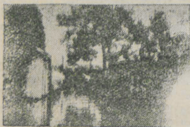
Siuza w Paniewie na kanale Augustowskim

Czy Polska posiada warunki do wykorzystania śródlądowych dróg wodnych? Tak. Polska jest przez naturę bogato wyposażona w możliwości stworzenia najtańszych środków komunika-