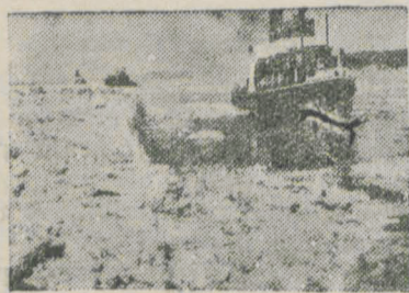
Łamacz lodu na Wiśle

Wszystkie wyżej wspomniane połączenia wodne po ich całkowitym zrealizowaniu stwarzają możliwości wielkich tranzytów międzynarodowych, co