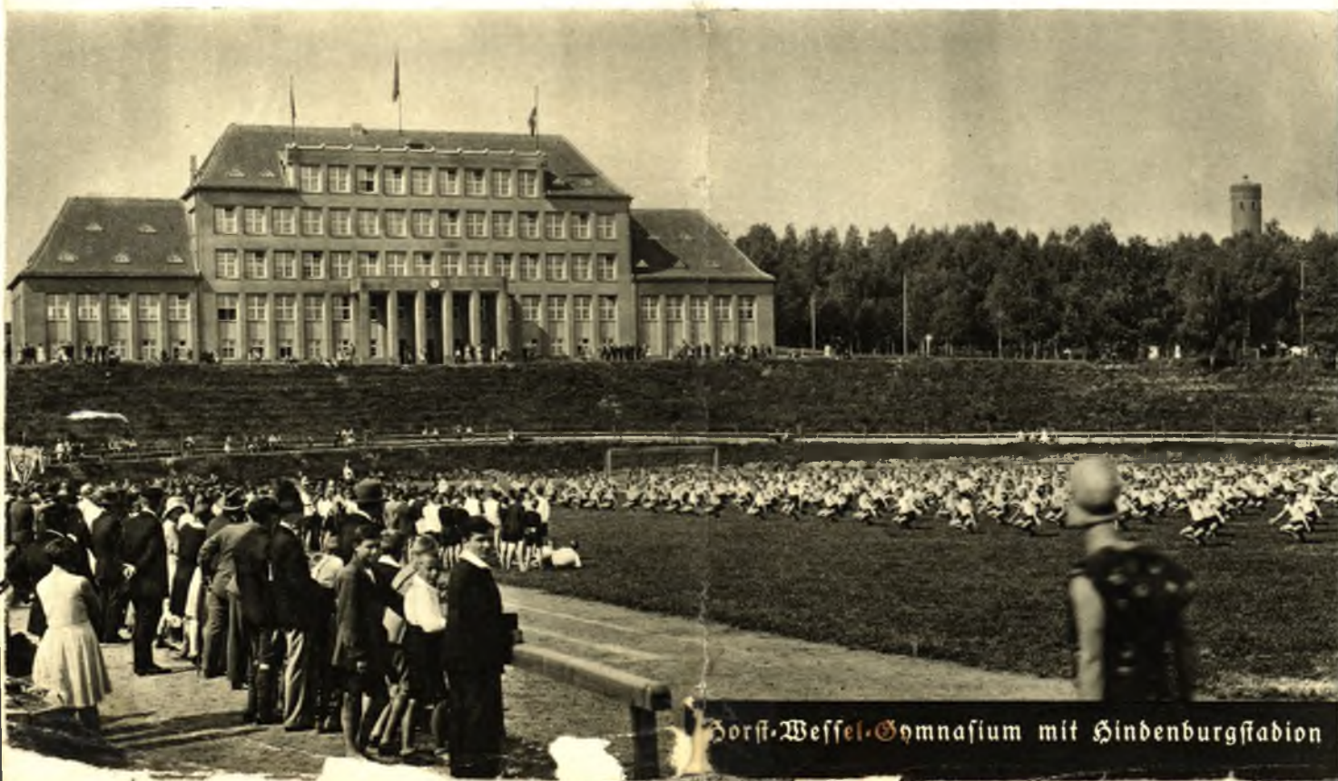
Borsch-Wessel-Gymnasium mit Hindenburgstadion