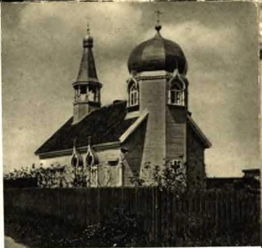
Philipponen, Russen, Kirche in Edertsdorf