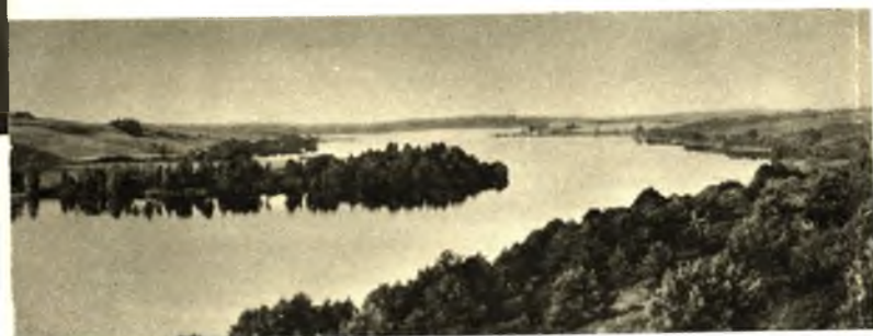
Blick von den Tennisplätzen auf den Junossee