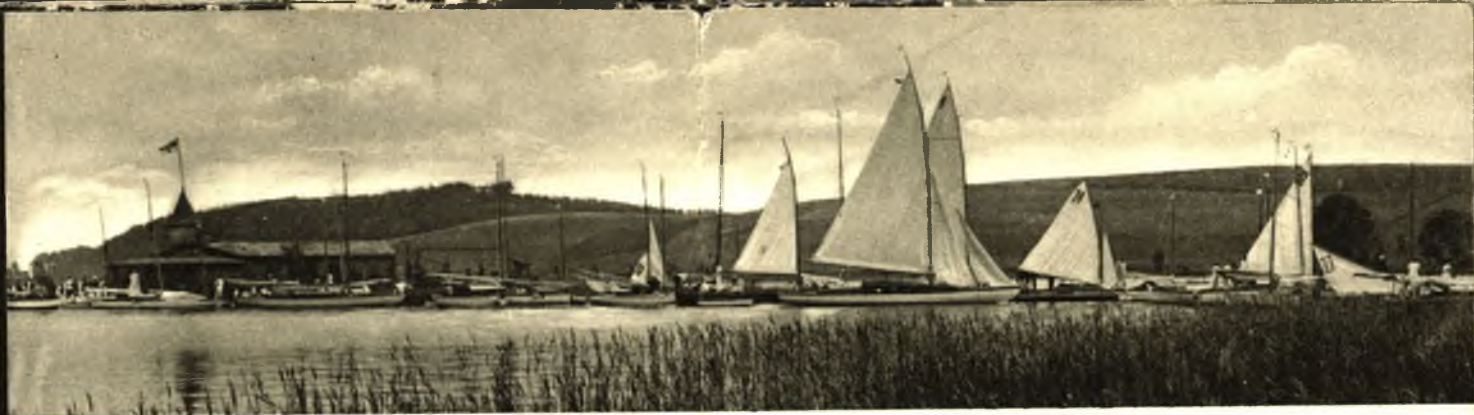
Klubinsel und Segelregatta in Nikolaiken

Nikolaiken, das sich stolz das masurische Vene- dig nennt, am Tal- ter Gewässer und Nikolaitersee und nahe der Forstherr-