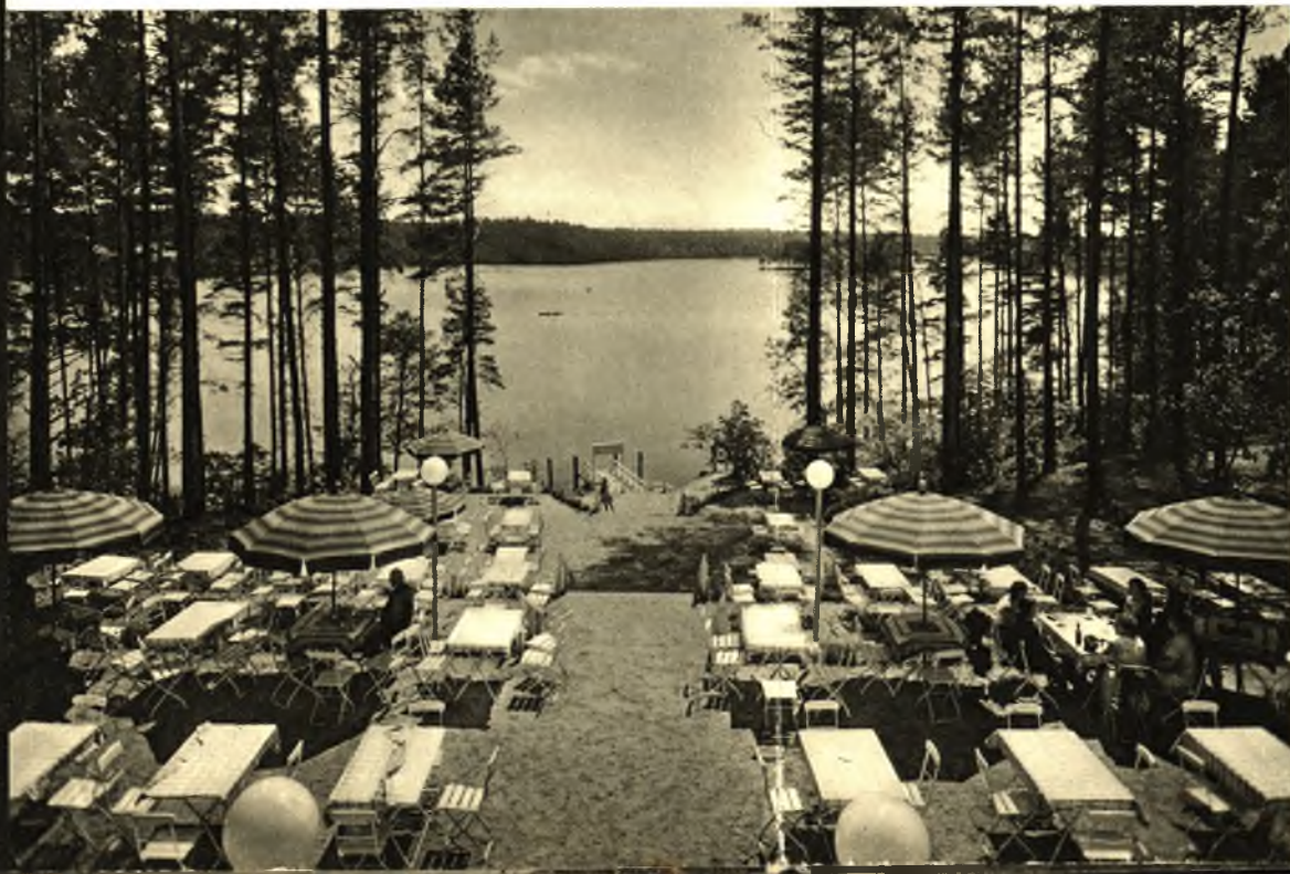
Provinzial-Kurhaus Rudczanny. Dampferanlegegestelle. 1932 eröffnete neuzeitlich ausgestattete Gaststätte, mitten im Hochwald auf steiler Uferhöhe mit weitem Blick auf den Niedersee. 25 Minuten vom Bahnhof. Kurhausterrassen.