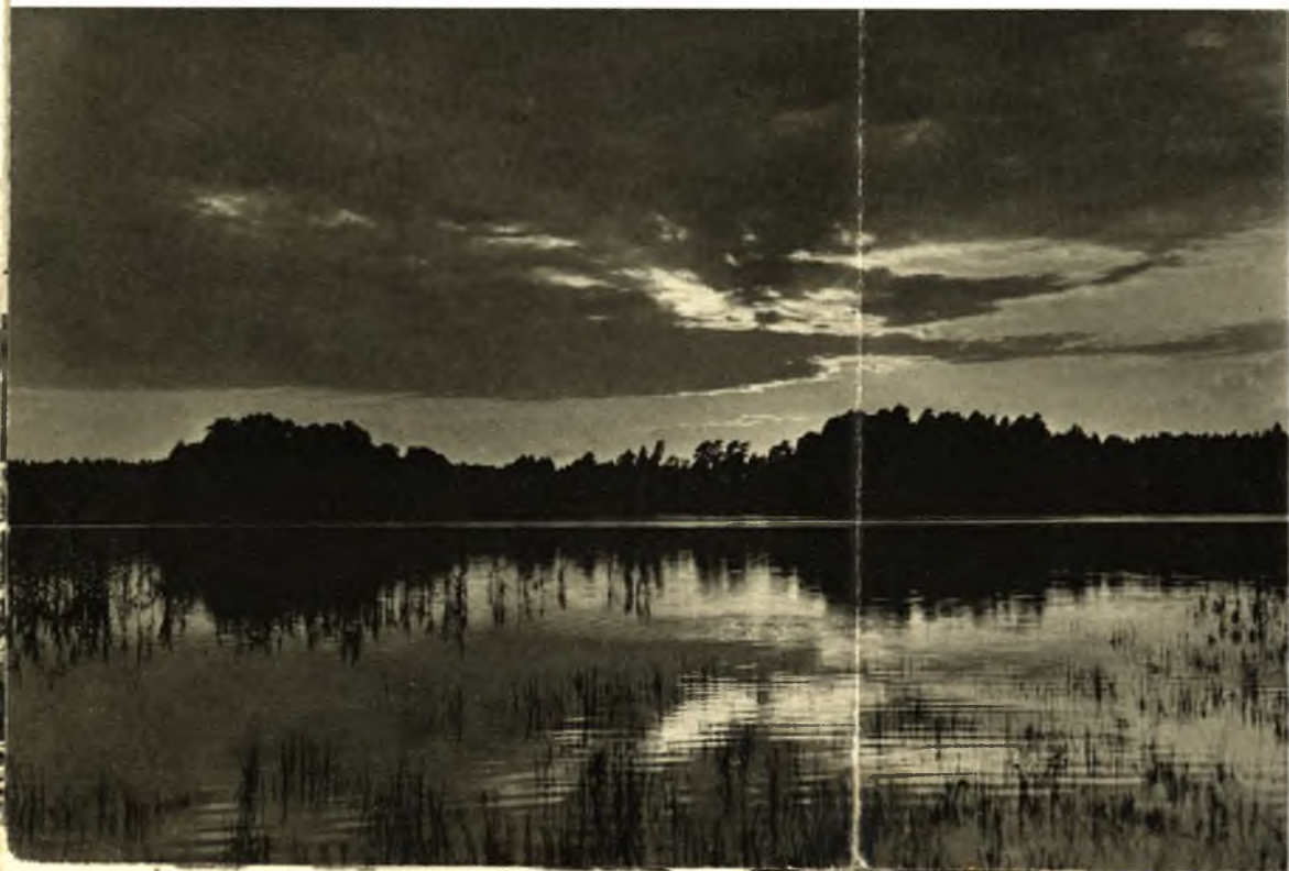
Abendstimmung am Niedersee