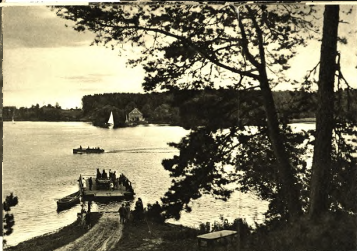
Fähre und Gasthaus Wirsa. Dampfer- anlegestelle. Idyllisch gelegene, viel besuchte Erholungsstätte mit zwei Logierhäusern