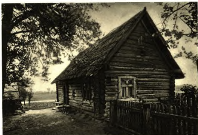
Blockhaus in Edertsdorf

am Cruttinnafluß und Forst, Bahnstation, beliebte Sommerfrische, drei Gasthäuser, Privatpensionen. Herrliche Falsfahrt auf dem Cruttinnafluß nicht versäumen.