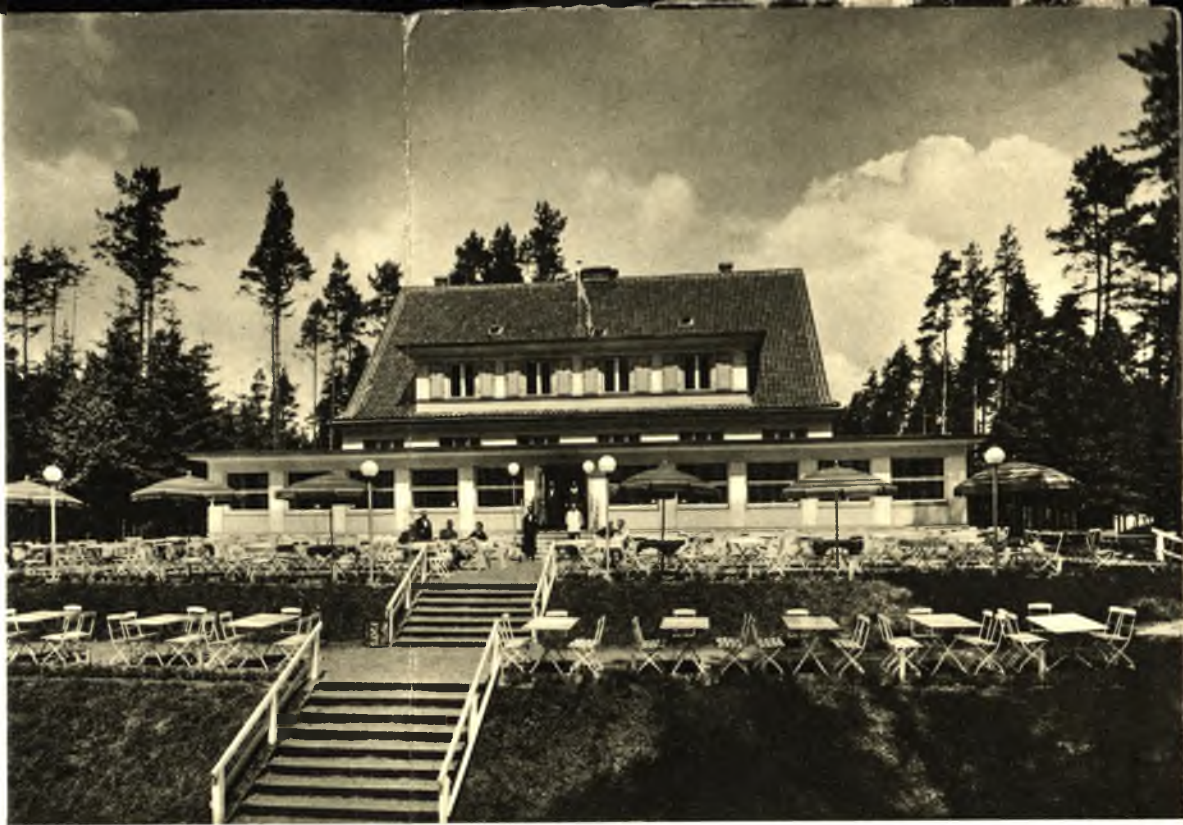
Rudczanny , Bahnstation, Endpunkt der masurenischen Dampferlinien, beliebter Ausflugsort und Sommerfrische, Provinzial-Kurhaus, Gasthaus, Privatpensionen.