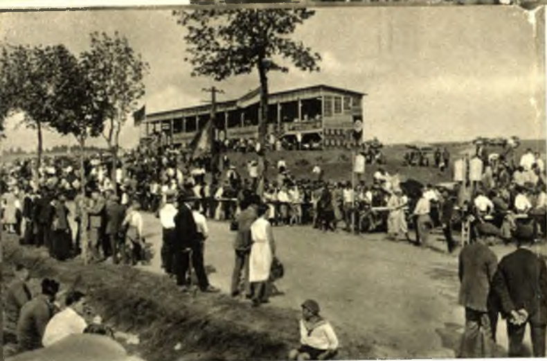
Motorrennstrecke „Ostpreußenring Sensburg“