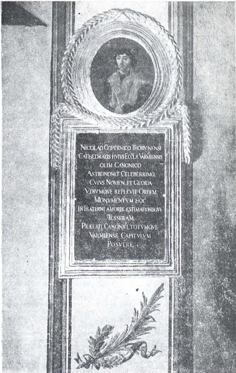
6. Epitafium M. Koperni- ka w kate- drze we Fromborku.