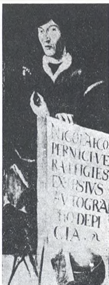
3. Portret M. Kopernika z wieży zegarowej w Strasburgu.

Znane dotąd portretowe podobizny Kopernika biorą swój początek z trzech centrów: Prus polskich, Strasburga w Alzacji i Wittenbergi w Saksonii. Na podstawie obszernej literatury poświęconej wizerunkom Mikołaja Kopernika możemy stwierdzić, które z portretów uchodzą za autentyczne i jedno z pierwszych, jak również wyciągnąć wnioski do którego z portretów najbardziej zbliżony jest portret ze zbiorów Domu Jana Matejki.