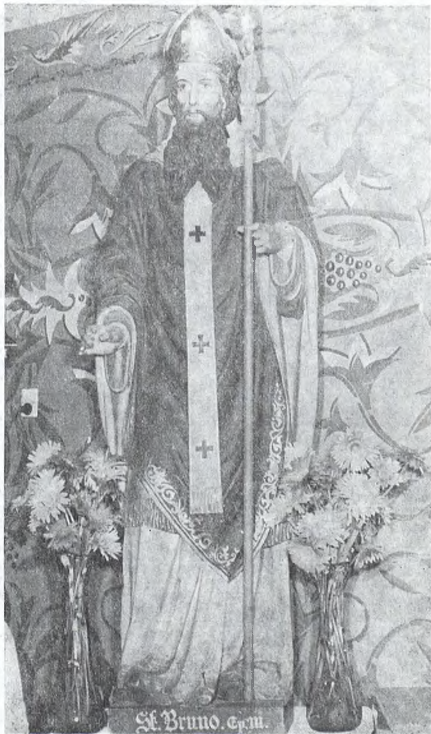
3. Figura św. Brunona z kościoła w Olsztynku.