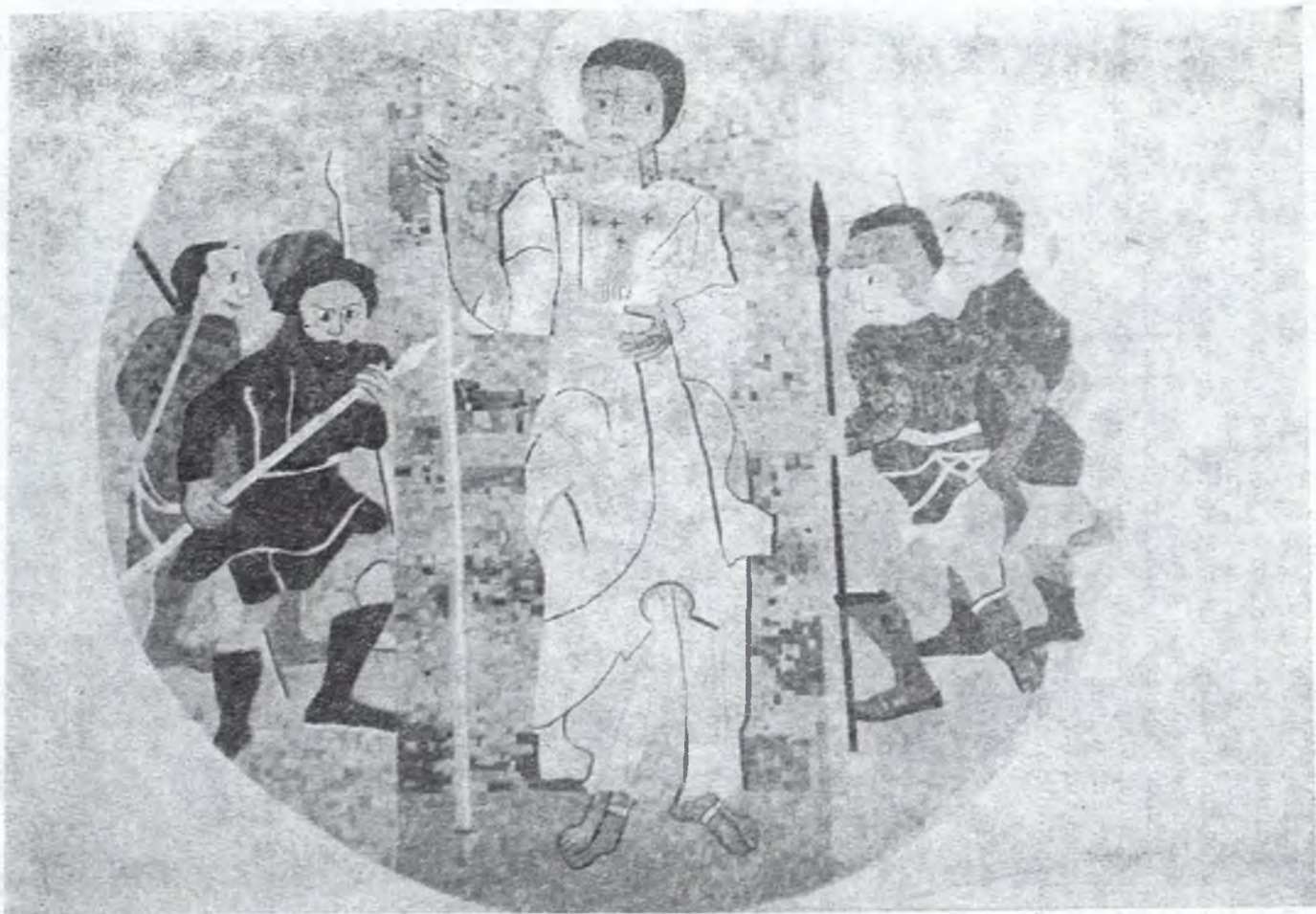
1. Mozaika z frontonu kościoła w Giżycku przedstawiająca scenę męczeństwa św. Brunona.