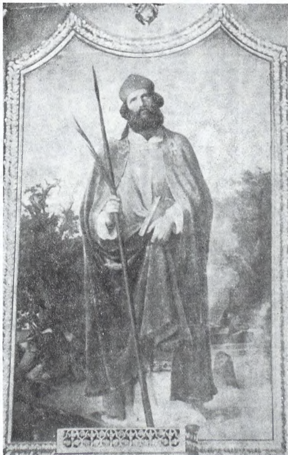
2. Obraz św. Brunona z neogotyckiego ołtarza kaplicy domu biskupiego we Fromborku