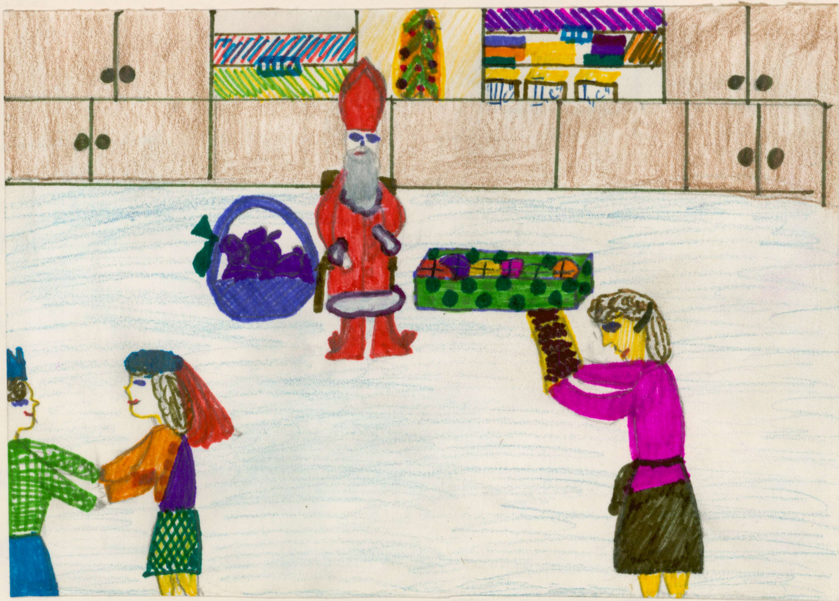
Rys. Ania Grzelak uc. kl. III c.