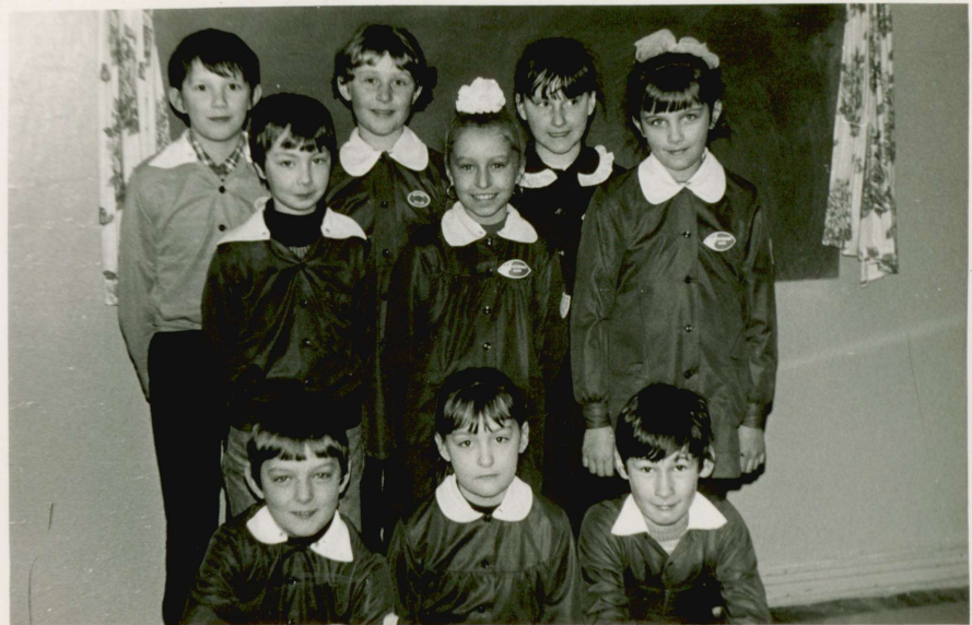
Wzorowi uczniowie kl. III c