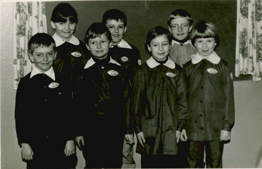
Wzorowi uczniowie kl. II c.