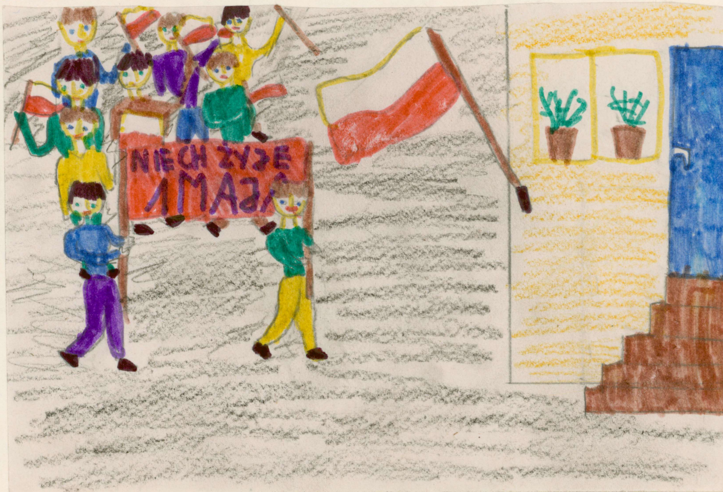
Rys. Mianusz Wrzesiński ucz. kl. III c.