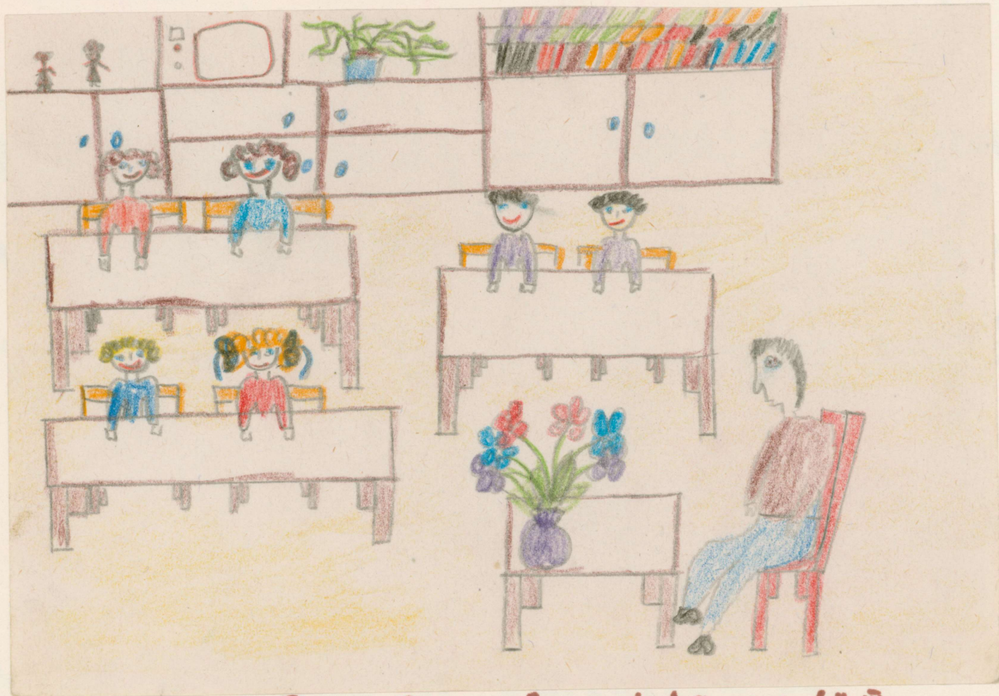
Rys. Ania Łęczyńska ucz. kl. III.